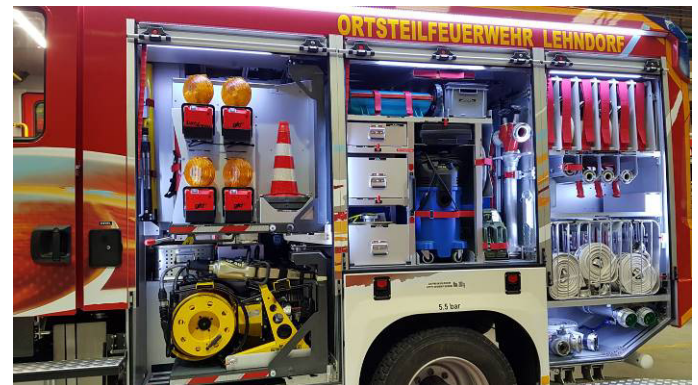
Das Bild zeigt eine mögliche Fahrzeugausstattung und ist nicht bindend.