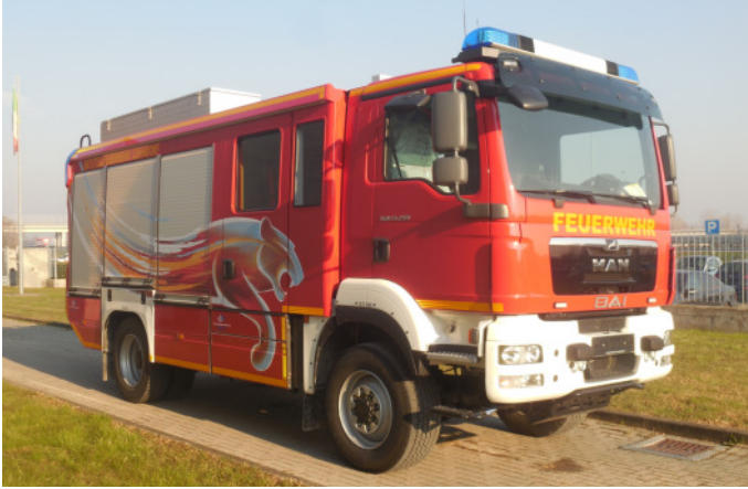
Das Bild zeigt eine mögliche Fahrzeugausstattung und ist nicht bindend.

Geräteräume: drei pro Fahrzeugseite (sieben Geräteräume gesamt), Aluminiumrollläden mit Stangen-Verschlässen (Barlock) seitlich sowie hinten am Pumpenraum, alle abschließbar