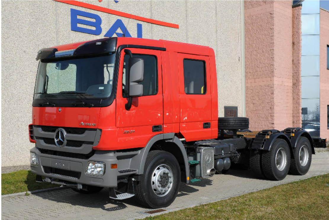
Das Bild zeigt eine mögliche Fahrzeugausstattung und ist nicht bindend.

Die Firma BAI ist der offizielle Partner der Daimler AG für die Entwicklung und Fertigung von Mannschaftskabinen auf Mercedes-Benz Actros Fahrgestellen. Nach der Fertigstellung einer Kabinenverlängerung, inklusive aller Inneneinbauten und Außenanbauten wird das Fahrgestell zurück an Daimler und von dort an die verschiedenen Aufbauhersteller geliefert.