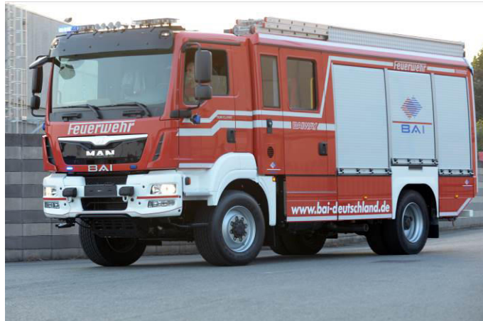
Das Bild zeigt eine mögliche Fahrzeugausstattung und ist nicht bindend.

Geräteräume: drei pro Fahrzeugseite (sieben Geräteräume gesamt), Aluminiumrollläden mit Stangen-Verschlässen (Barlock) seitlich sowie hinten am Pumpenraum, alle abschließbar