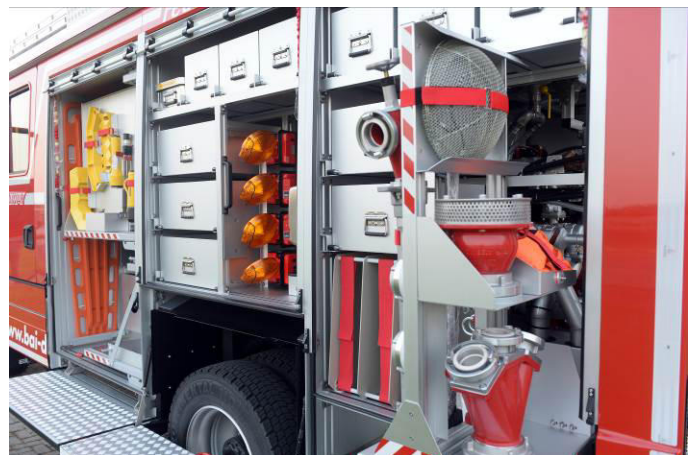
Das Bild zeigt eine mögliche Fahrzeugausstattung und ist nicht bindend.